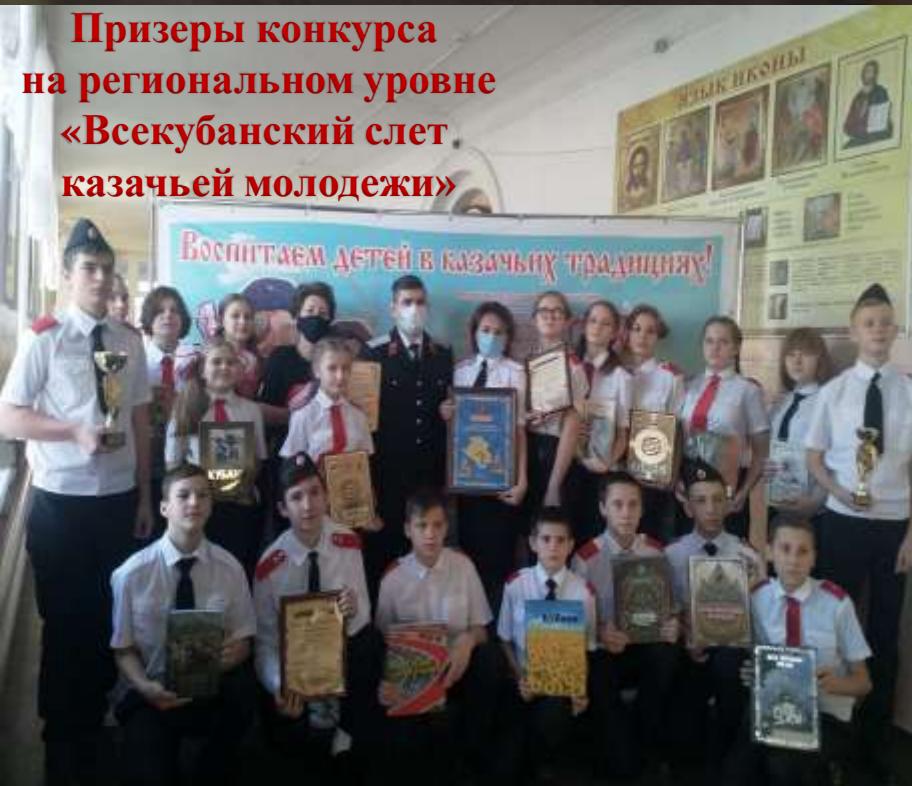
Призеры конкурса на региональном уровне «Всекубанский слет казачьей молодежи»