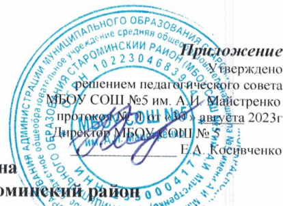
Приложение Таблица- сетка часов учебного плана МБОУ СОШ №5 им. А.И. Майстренко МО Староимирский район для 11 класса гуманитарного профиля социально — педагогической направленности, реализующего федеральный государственный образовательный стандарт основного общего образования в 2023 – 2024 учебном году