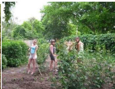
Школа и приусадебный участок