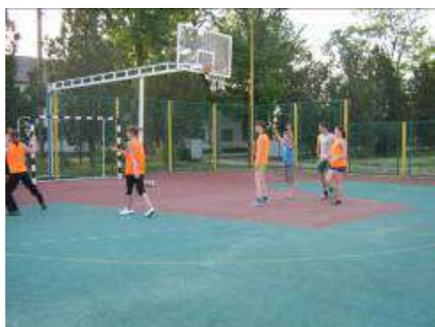
Спортивно – игровая площадка