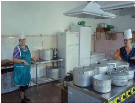
Варочный цех школьной столовой